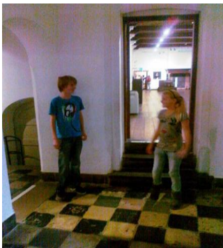
In het Prinsenhof